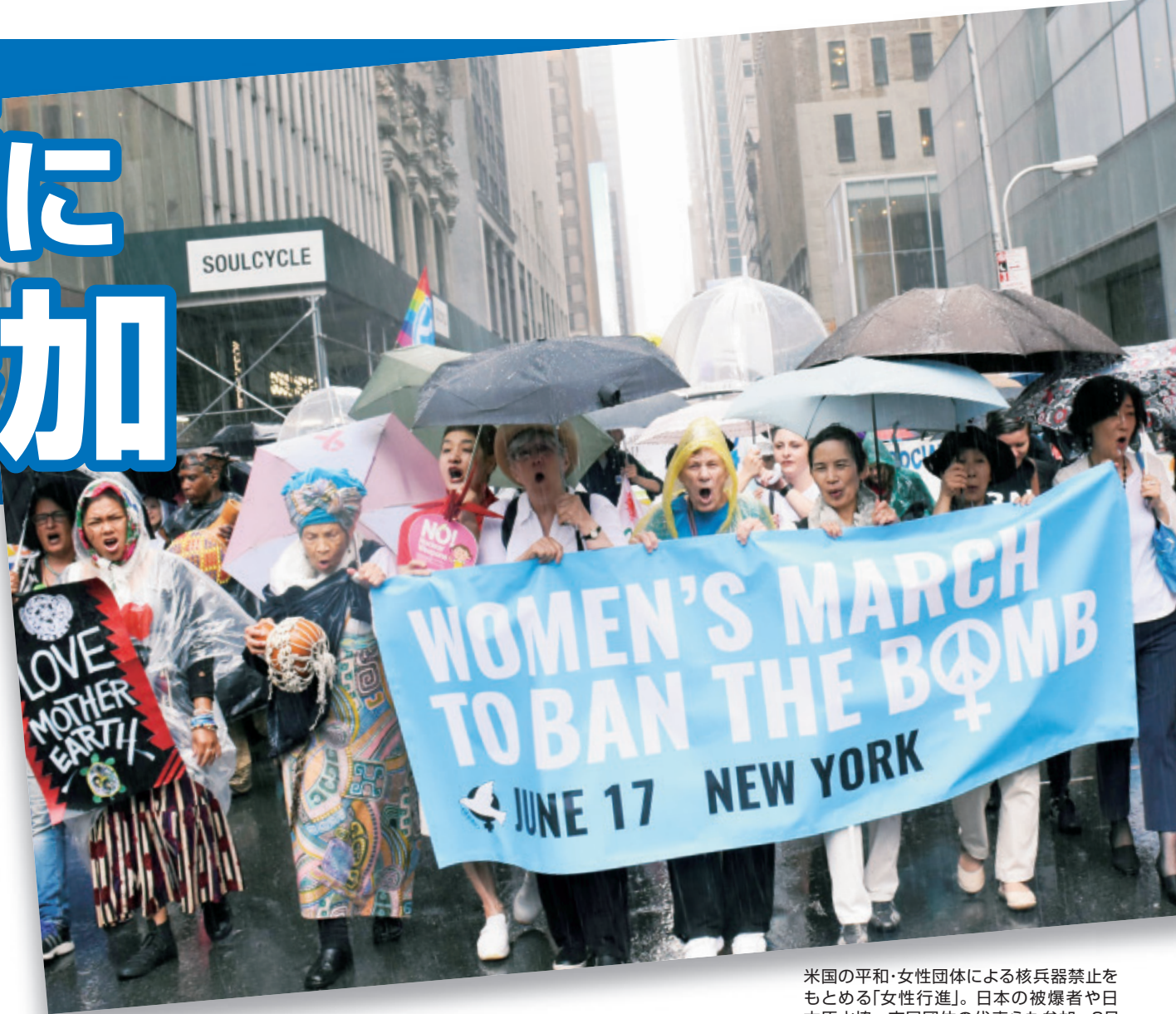
米国の平和・女性団体による核兵器禁止をもとめる「女性行進」。日本の被爆者や日本水協、市民団体の代表らも参加=6月17日、ニューヨーク

人類史上はじめて核兵器を違法化し、禁止する条約について話し合う国連会議。日本共産党からは、志位和夫委員長(写真左)を団長に、緒方靖夫副委員長、笠井亮衆院議員、井上哲士参院議員、大平喜信衆院議員らが出席。日本の被爆者をはじめ各国のNGO、政府、国連関係者とともに、核兵器禁止条約実現のため全力をつくしています。