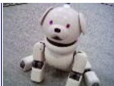
ロボスクウェア 人を見分けて話しかけに反応します