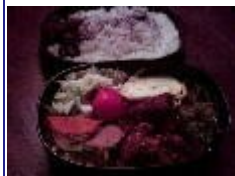
プチトマト玉子焼き、鳥のから揚げ、しし唐とじゃこの甘辛、ウインナと野菜の炒め物、キャベツとりんごのサラダ

○20億問題で自宅をとられた方が、本日愛知で告発を行ったとの事。 新たな局面を迎える。 ○地震と、水害支援で、日本共産党奈良県委員会が、救援物資を送るとの連絡有。 小銭入れの箱を持って両替に郵便局に行く。 郵便局で両替してもらえない事が分かる。銀行で機械で両替しようと思ったら、札を替えるのはできるが効果の場合は有料カードが必要との事で窓口でやっと両替してもらった。17,730円なり。 現地では不足していると連絡のあった、カップめん、水、カイロを買込んで地区委員会に届ける。 ○夕方5時から、王寺駅で救援募金の呼びかけ宣伝、王寺、河合、上牧の議員と行う。1時間で27,970円が集まる。 中学生や高校生が、財布からおこづかいを出して入れてくれる。わざわざ戻ってきてカンパをしてくれる方もいる。みんなの関心が高い。避難している方々が10万人 ○葛城市長選、知人に電話依頼。いい人が出ていると近所で話していたところと支持を約束してくれる。 ○相談4件。土地問題、年金。ゴルフ場跡地、教育 ○明日から県外視察。日記は帰ってから、報告します